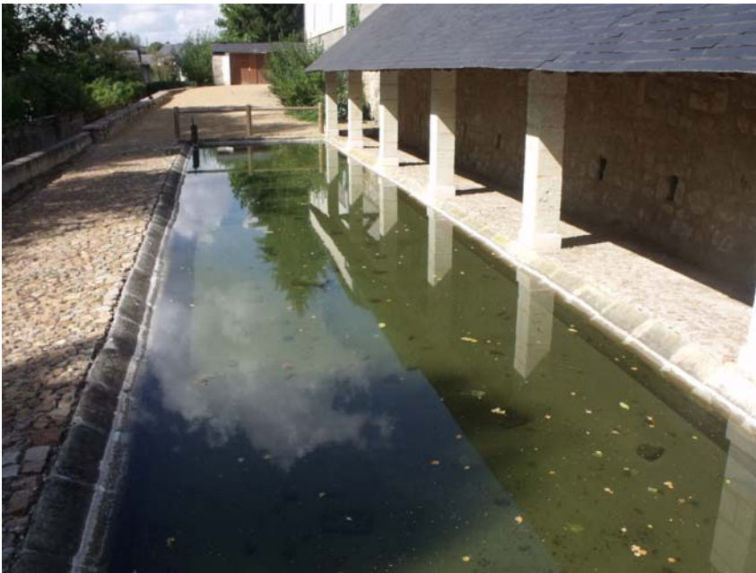
Lavoir de Fontevraud