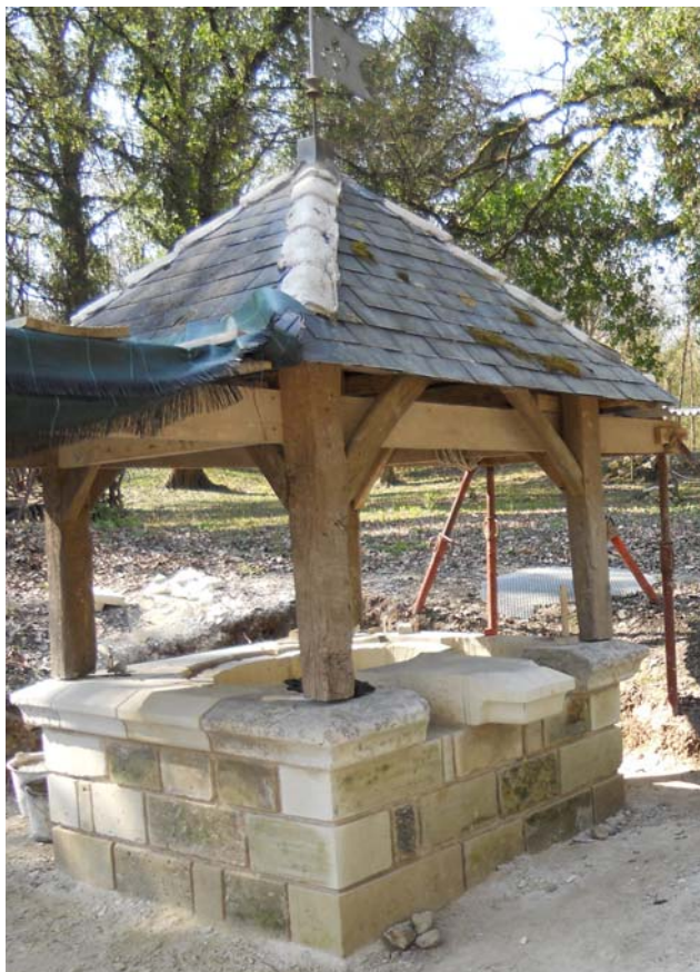
Puits médiéval et entrée de souterrain avec voûte en arc à la Chevalerie de Sacé